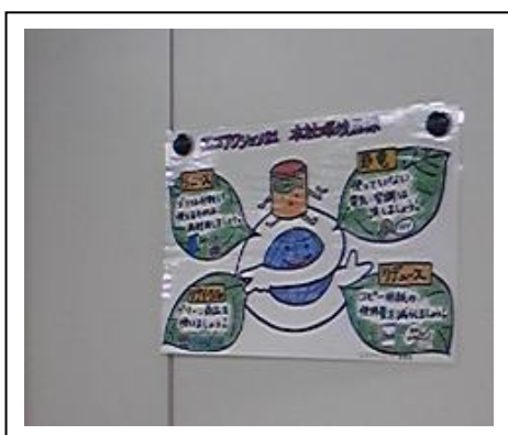
環境活動啓蒙ポスター