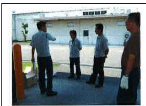
緊急時対応訓練風景

■環境活動レポートに関するお問い合わせ先 株式会社バスクリン CSR推進グループ 〒108-0023 東京都港区芝浦 4-3-4 田町きよたビル 4F TEL:03-6327-2911 FAX:03-3453-8182 次回環境活動レポート発行予定：2011年6月 第2号