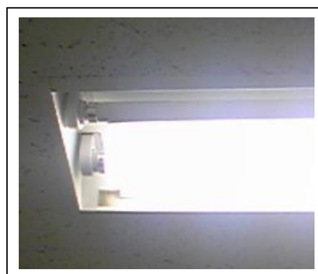
本社反射板設置風景