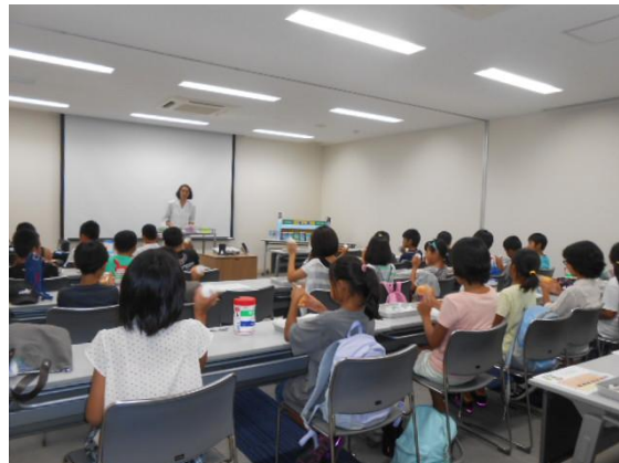
入浴剤手作り体験風景