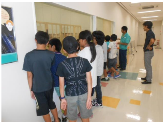
工場生産ラインの説明